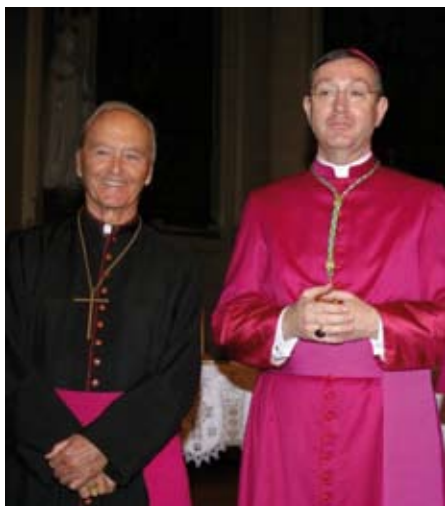
John Willem Gran OCSO og Bernt Eidsvig Can. Reg.

I 2007 kan emeritert biskop av Oslo John Willem Gran OCSO feire 50-årsjubileum for sin prestevigsel – og biskop Bernt Eidsvig Can.Reg. av Oslo sitt 25-årsjubileum for det samme. Biskop Gran trådte inn i cistercienserklosteret Caldey Abbey i Syd Wales i november 1949, og han ble presteviet samme sted i 1957. Biskop Eidsvig ble presteviet i Oslo av nettopp biskop Gran den 20. juni 1982. Dagene feires i felleskap, ved en offisiell markering den 24. august.