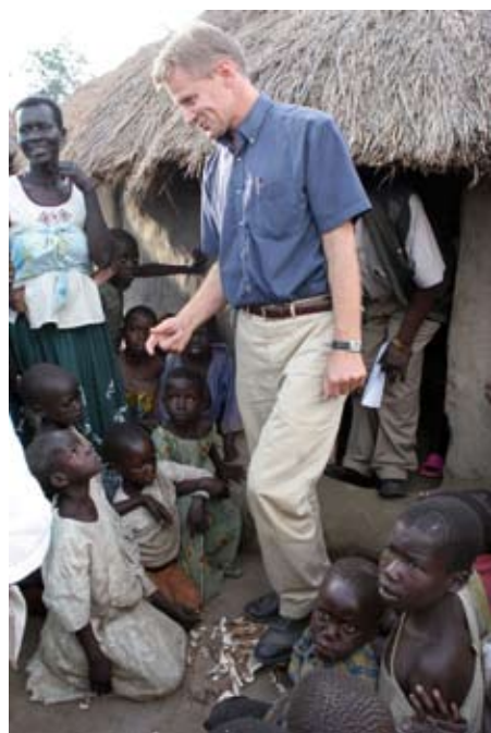
Jan Egeland.