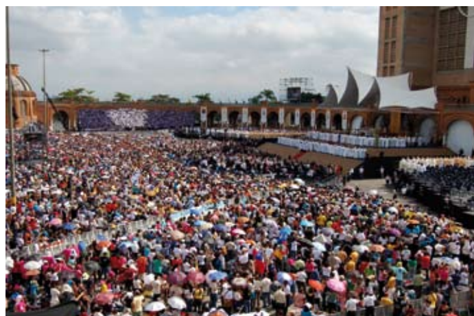
Fra åpningsmessen for den Latinamerikanske bispekonferansen i Aparecida, under pavens Brasil-besøk.