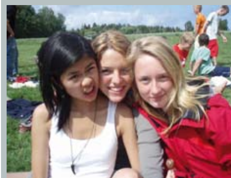
Fra NUKs ungdomsleir.

En beskrivelse av NUK i perioden 1997-2007 kan ikke avsluttes før det er sagt noen ord om leirene, ledertrening og lokallagene. Fortsatt er disse aktivitetene ryggmargen i det katolske barne- og ungdomsarbeidet, hvor man opplever en ung og levende Kirke!