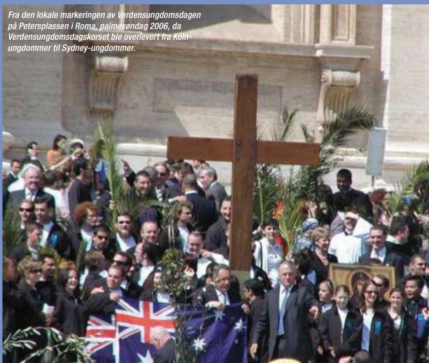
Fra den lokale markeringen av Verdensungdomsdagen på Petersplassen i Roma, påsøndag 2006, da Verdensungdomsdagskorset ble overlevert fra Köln-ungdommer til Sydney-ungdommer.

Fristen for å melde seg på NUKs sommerleire var 1. mai, men det er slett ikke umulig at det fortsatt er en plass ledig. De leirene vi arrangerer i sommer er Barneleir Nord-Norge (28/6-1/7), Barneleir Oslo/Østlandet (Mariaholm 23/6-30/6), Barneleir Sørlandet (Stella Maris ved Mandal 25/6-2/7), Juniorleir (12-14 år, Mariaholm 30/6-7/7), Vestlandsleir (8-14 år, Fredtun ved Haugesund 30/6-7/7), Barneleir Midt-Norge (14/7-21/7), Ungdomsleir (Mariaholm 27/7-5/8) og Familieleiren (Mariaholm 20/7-24/7). Familieleiren hadde påmeldingsfrist 31. mai.