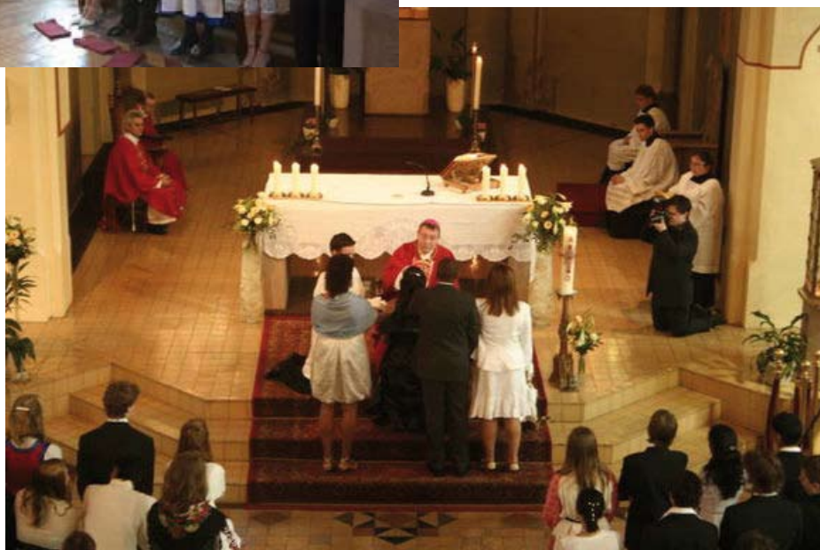
Fra fermingen i St. Olav domkirke, Oslo, lørdag 26. mai kl. 11.00.