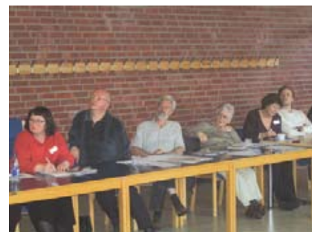
Fra Caritas Norges rådsmøte