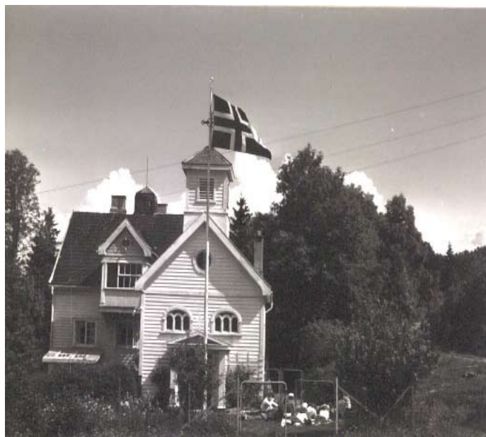
St. Hallvards kloster, Sylling, juni 1957.

En ukes fellesskap med unge katolikker, "timer" i tros lære, liturgi, apologetikk, foreningsteknikk, og om det kristne ekteskap – ja det var en utrolig opp-