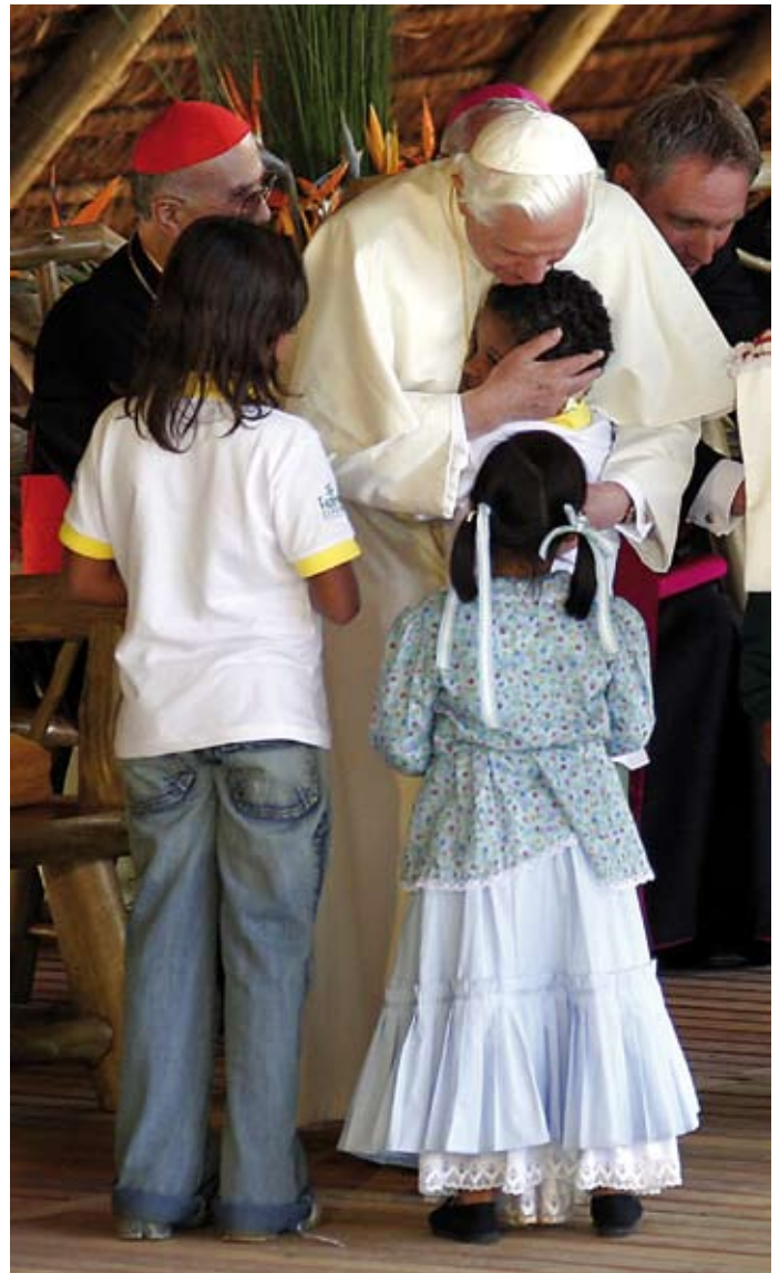
Fazenda da Esperança i Brasil.

I forbindelse med pavens reise til Brasil, har Broen intervjuet to latinamerikanske prester om Kirkens stilling i dagens Latin-Amerika,