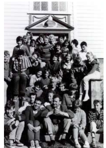
Juniorleiren på Sylling sommeren 1960.