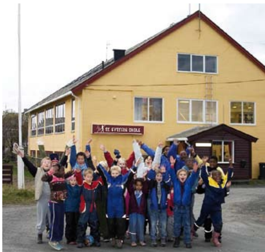
Elevene ved St. Eystein skole høsten 2005.

St. Eystein skole er godkjent for 84 elever, men de nåværende skolebygningene er ikke godkjent for flere enn 70. Planene er å på sikt også søke godkjenning for ungdomsskole.