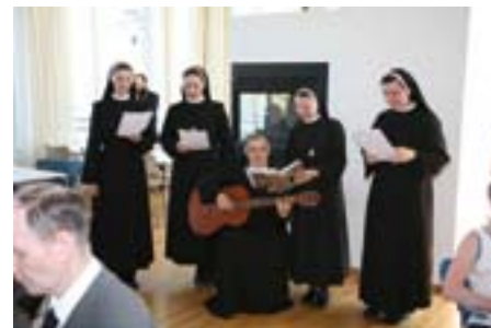
Søstrene underhold under mottagelsen.

Flere bilder fra feiringen finnes på Vår Frue katolske menighets hjemmesider: www.varfrue.com .