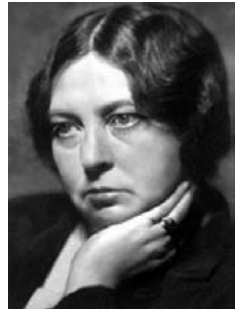
Sigrund Undset utga i 1929 Gymnadenia , den første av hennes konversjonsromaner. Året etter kom Den brønnende busk .

Tross Pauls skakende møte med Kristus i sakramentet, veien frem til konversjon ble kronglete og tung. Men som så mange andre konvertitter finner han veien til messen uten å være tatt opp i kirkens fellesskap. Det er en avklart Paul som begir seg til høymessen søndag formiddag i St. Olav. Han vandrer forbi Trefoldighetskirken og opp til kirken lenger oppe i bakken. "Sett slik nedenfra gaten tok kirken seg virkelig godt ut på terrassens grå stensokkel, med den brede trappe opp, og det rødbrune, fronttårn, hvis slanke spir pekte opp i den blå luft. I dag stod hovedportalen fremme på tårnet vidåpen." Paul finner sin plass midt i kirken." Så satte orgelet i – og noen små korgutter og en prest i grønn kåpe var kommet frem til alteret." Så "gjennomgår" Undset hele messen, ledd for ledd, slik Paul opplever den, ikke helt fortrolig med alle ledd, men åpen, og