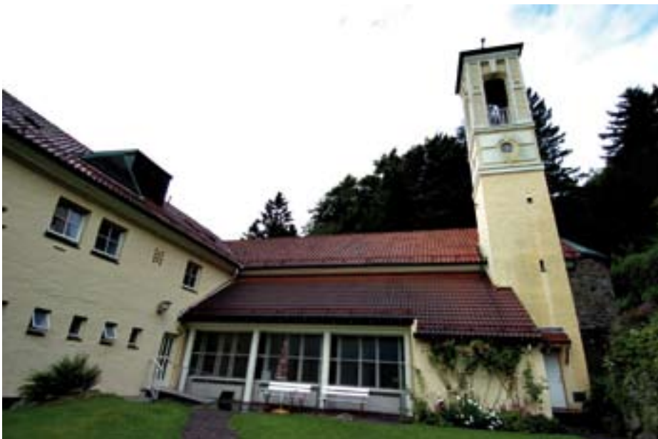
Marias Mindes kirke “Himmeldronning” feirer 50 år

Da Marias Minde skulle bygges på midten av 50-tallet, måtte det selvsagt settes av plass til et kapell. Det ble en hel kirke – Marias Himmeldronning – sådan en av byens peneste kirker. Den 6. oktober skal St. Franciskus Xaverius-søstrene feire kirkens 50-årsdag.