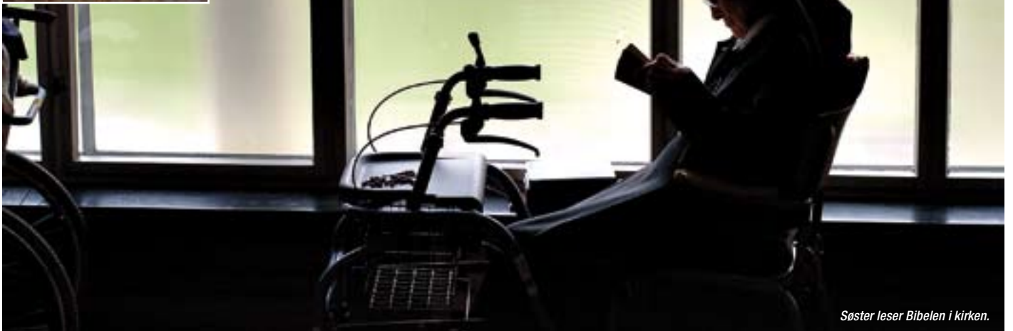
Søster leser Bibelen i kirken.