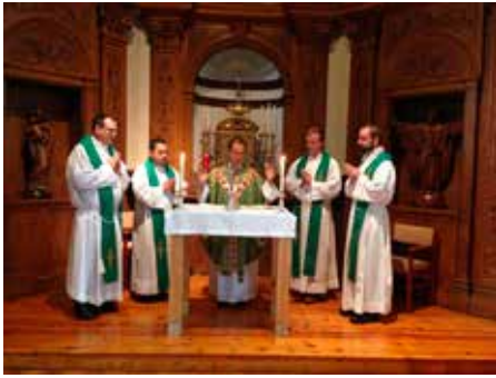
Den hellige messen var en selvskreven del av programmet.

menneskelige formasjon også etter prestevielsen, organiserte en gruppe prester i Oslo katolske bispedømme en studietur i slutten av august.