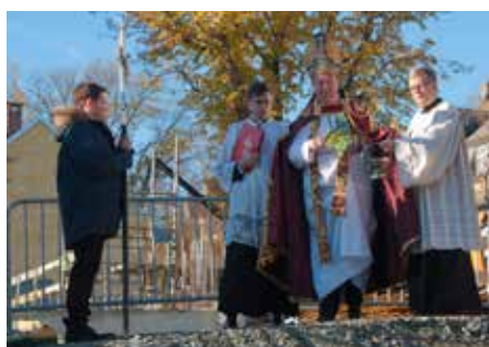
Fersk generalvikar og sogneprest assisterer ved velsignelsen av tomten.