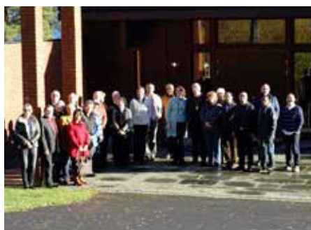
Pastoralrådet i OKB.

Pastoralrådet i OKB var siste helg i oktober samlet på Mariaholm. Hovedsaken var «menigheten som arbeidsplass», både for ansatte og frivillige. Forsamlingens forventninger i forhold til hva administrasjonen i bispedømmet skal/kan levere ble diskutert, både på det administrative, praktiske og pastorale området. En hovedkonklusjon var at pastoralrådet i OKB mener at bispedømmets administrasjon må gjenspeile den relativt nye virkeligheten som er ute i menighetene. Møtet vedtok et sluttokument med sine anbefalinger til biskopen. Hele sluttokumentet kan leses på katolsk.no.