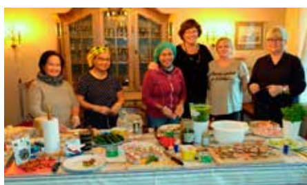
Ingen fest uten dugnadsgjeng på kjøkkenet.