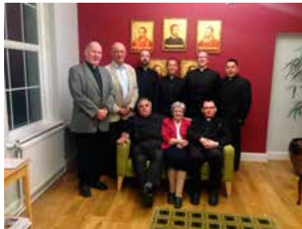
De fem OKB-prestene med staben i Allen Hall.

Dag 2 var viet det menneskelige og gikk med til diskusjoner internt i gruppen. Både temaene som ble presentert dagen før og egne opplevelser som prester i Norge, ble tatt opp til samtale. I tillegg til messen ble det satt av en time til eukaristisk tilbedelse, viet bønn for prestekall i bispedømmet.