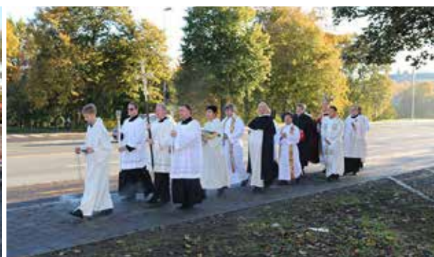
Prosesjonen gikk langs innfartsveien til Trondheim sentrum.