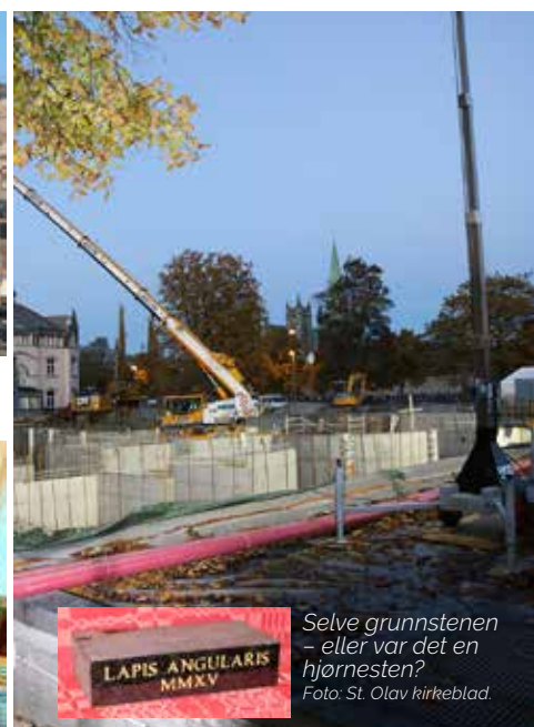
Selve grunnstenen – eller var det en hjørnestein?