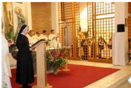
Under messen var det løftefornyelse.