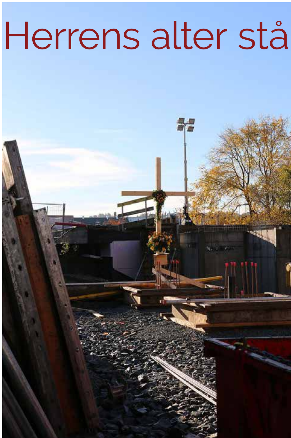
Korset markerer hvor alteret skal stå.

Jeg har prøvet å regne etter, og er kommet frem til at det er fjerde gang vi bygger en katolsk domkirke i Trondhjem: Den første var Olav Kyrres, den annen står ennu og trenger ingen introduksjon, den tredje ble fullført i 1973 og revet ifjor. Den fjerde ser vi vage konturer av, her vi står. Dette er ikke hele historien, vi må ta med en femte. I 1902 bygget vi om Størenbanens lokomotivstall til St. Olav kirke; denne ble domkirke da Trondhjem igjen fikk katolsk biskop i 1953. Jeg tør fastslå at det er få byer i verden hvor vår iver og utholdenhet i domkirkebygging har vært større. Så håper jeg at