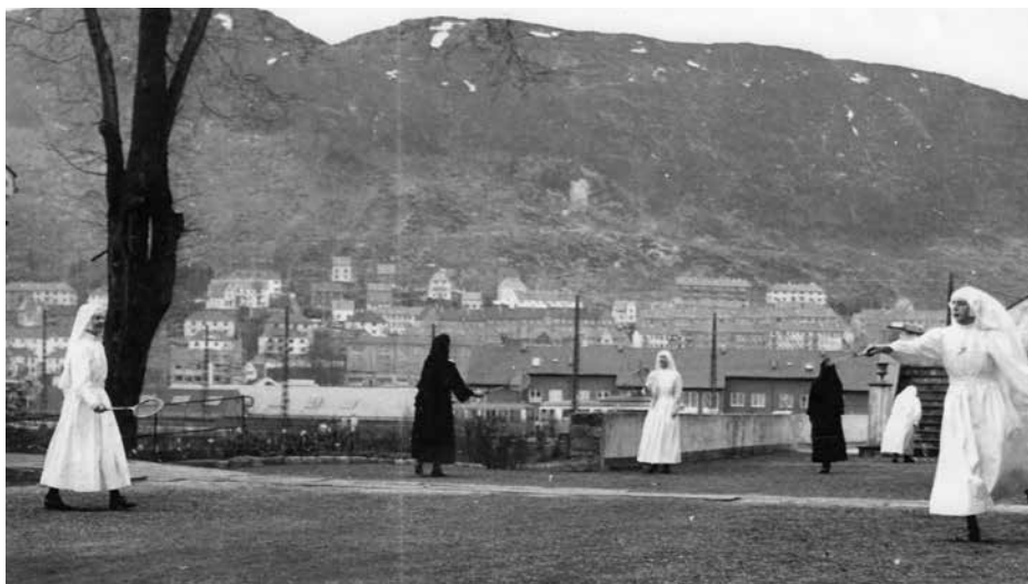
På Florida i 1950-årene