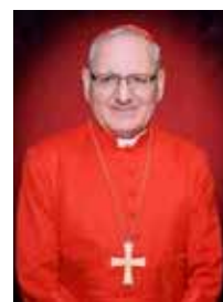
Patriark Louis Sako

Mosul er «våre fedre og bestefedres land, vår historie og våre minner», sier den kaldeiske patriark Louis Sako i anledning av at det er ett år siden terrorgruppen ISILs overtagelse og okkupasjon av Mosul, Iraks nest største by.