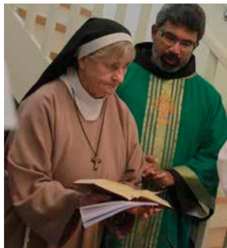
Sr. Walburgis med indiske fr. Babu, en nøkkelperson i prosessen.

Ministranter fra menigheten bisto biskopen. Vietnamesiske barn i vakre silkedrakter danset til Marias ære. Nyankomne søstre bar fram offeret og leste forbønnene, barne- og ungdomskoret sang med sine klare og