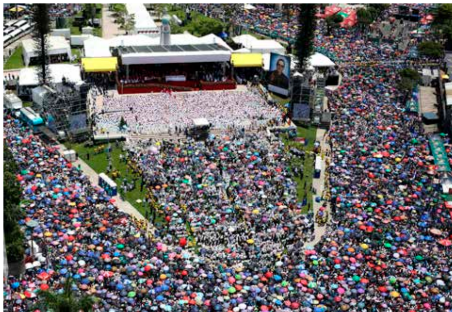
Ca. 300 000 katolikker feirer saliggjøringen av erkebiskop Romero i San Salvador den 23. mai 2015.

Mandag den 24. mars 1980 ble den 62-årige erkebiskop Oskar Romero skutt mens han feiret messe i et lite