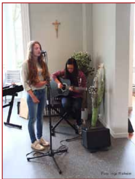
W dniu otwarcia gimnazjum miało 43 uczniów w dwóch równoległych klasach pierwszych. Dwie uczennice wykonały piosenkę podczas uroczystości rozpoczęcia działalności nowej szkoły.

Po zakończeniu Mszy św. uczniowie i zaproszeni goście przeszli do szkolnej