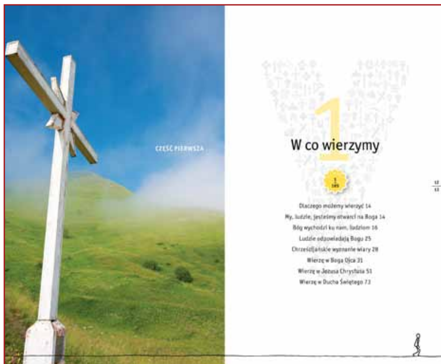
Youcat - katechizm dla młodych

Rada Kapłańska podejmie tematykę Roku Wiary zgodnie z wytycznymi Kongregacji Nauki Wiary, podczas swojego jesiennego spotkania.